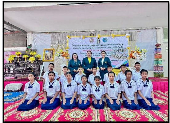
”ร่วมประชุมเชิงปฏิบัติการจัดทำแผนประจำปี ๒๕๖๘” “ส่งเสริมให้นักเรียนเข้าประกวดสวดสรภัญญะ”