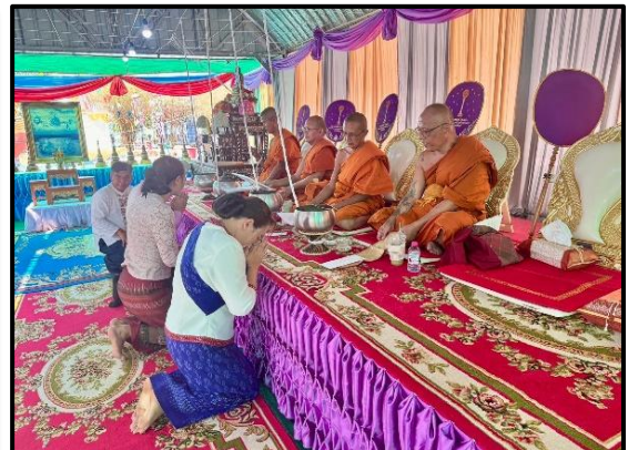
เข้ากิจกรรมในงานบุญเดือน ๓ ที่วัดบางอัมพวัน ตำบลบ้านตาล อำเภอบำเหน็จณรงค์