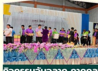
กิจกรรมจับฉลาก ภาคกลางวัน