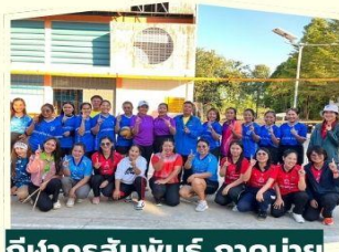
กีฬาครูสัมพันธ์ ภาคบ่าย