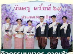
กิจกรรมบูชาครู ภาคเช้า