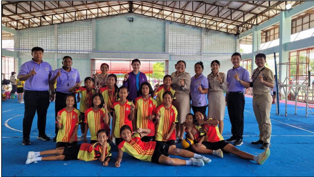
ภาพกิจกรรม

๓. กิจกรรมการแข่งขันกีฬาเพื่อคัดเลือกตัวแทนอำเภอบำเหน็จณรงค์ เมื่อวันที่ ๑๗ กันยายน ๒๕๖๗ โรงเรียนชุมชนชนวนวิทยานำนักเรียนเข้าร่วมการแข่งขันกีฬา เพื่อคัดเลือกตัวแทนอำเภอบำเหน็จณรงค์ เข้าร่วม การแข่งขันกีฬานักเรียน สพป.ชัยภูมิ เขต ๓