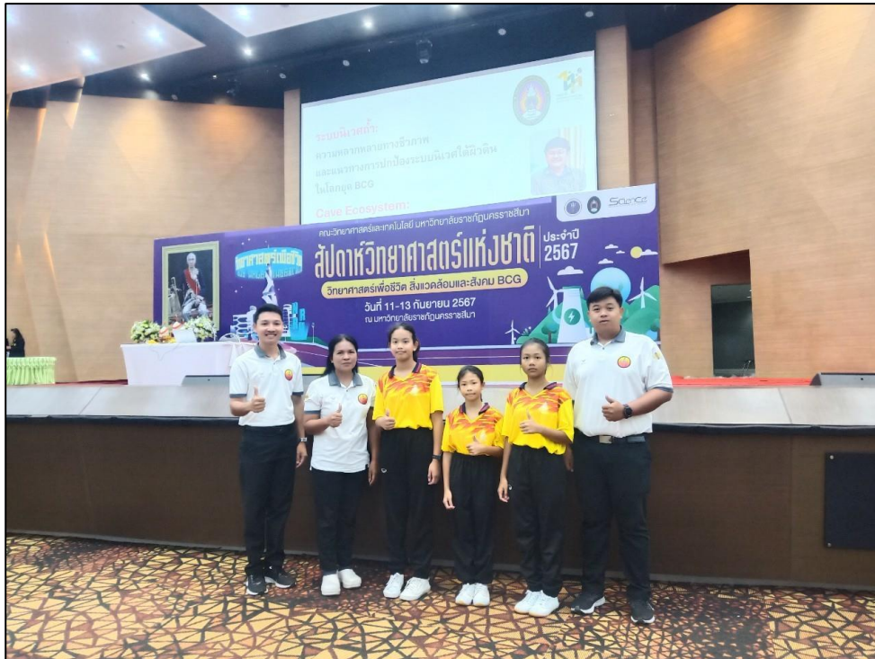
ภาพกิจกรรม

๒. กิจกรรมการแข่งขันโครงงานวิทยาศาสตร์ เมื่อวันที่ ๑๑ - ๑๒ กันยายน ๒๕๖๗ โรงเรียนชุมชน ชนวนวิทยานำนักเรียนเข้าร่วมการแข่งขันโครงงานวิทยาศาสตร์ งานสัปดาห์วิทยาศาสตร์แห่งชาติ ณ มหาวิทยาลัยราชภัฏนครราชสีมา