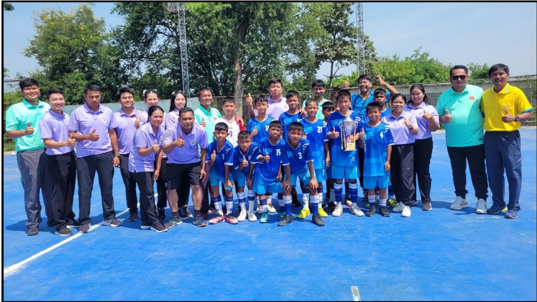
ภาพกิจกรรม

๑. กิจกรรมการแข่งขันกีฬานักเรียน สำนักงานเขตพื้นที่การศึกษาประถมศึกษาชัยภูมิ เขต ๓ เมื่อวันที่ ๖ - ๑๐ ตุลาคม ๒๕๖๗ โรงเรียนชุมชนชนวนวิทยา นำนักกีฬาตัวแทนอำเภอบำเหน็จณรงค์ เข้าร่วมการแข่งขันกีฬานักเรียน สำนักงานเขตพื้นที่การศึกษาประถมศึกษาชัยภูมิเขต ๓