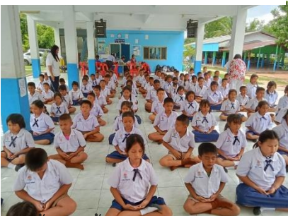
ปูพื้นกระเบื้องอาคารเป็นลานกิจกรรม