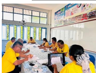
ประชุมคณะกรรมการสถานศึกษาฯ