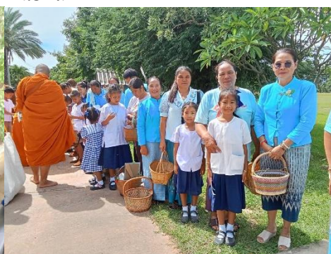
วันแม่แห่งชาติ พ.ศ.๒๕๖๗