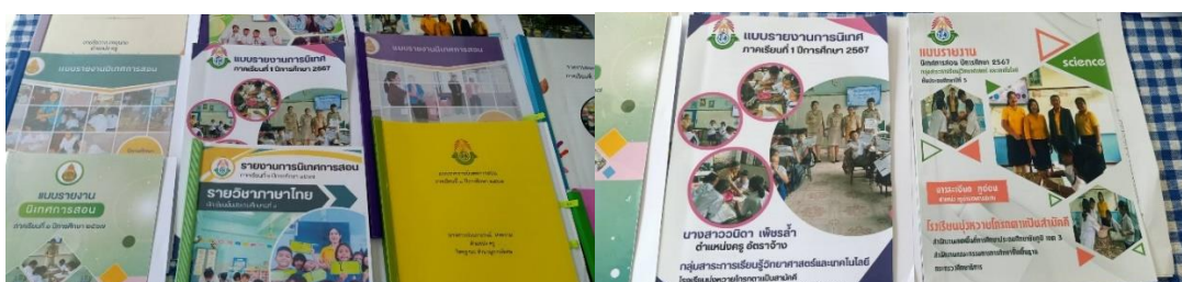
แบบรายงานการนิเทศการสอนภาคเรียนที่ ๑/๒๕๖๗