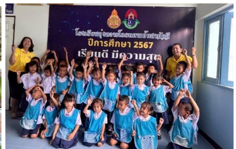
นักเรียน เรียนดี มีความสุข

ด้านการปฏิบัติตนในการรักษาวินัย คุณธรรม จริยธรรมและจรรยาบรรณวิชาชีพ