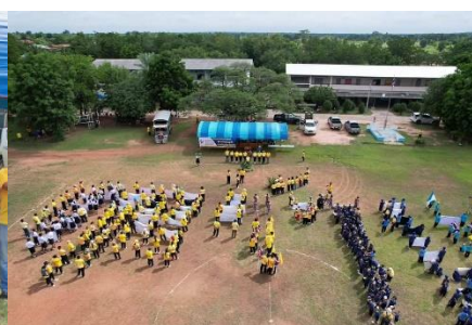
โครงการเดินรณรงค์ด้านยาเสพติด จัดโดย องค์การบริหารส่วนตำบลรังงาม