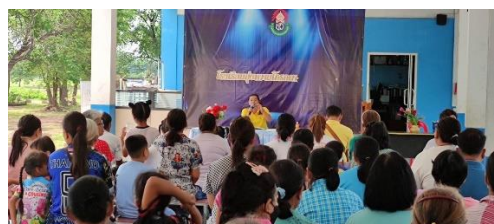
ประชุมผู้ปกครอง ภาคเรียนที่๑/๒๕๖๓