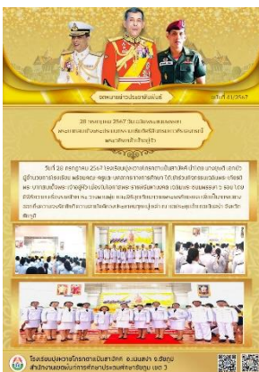
ข่าวประชาสัมพันธ์