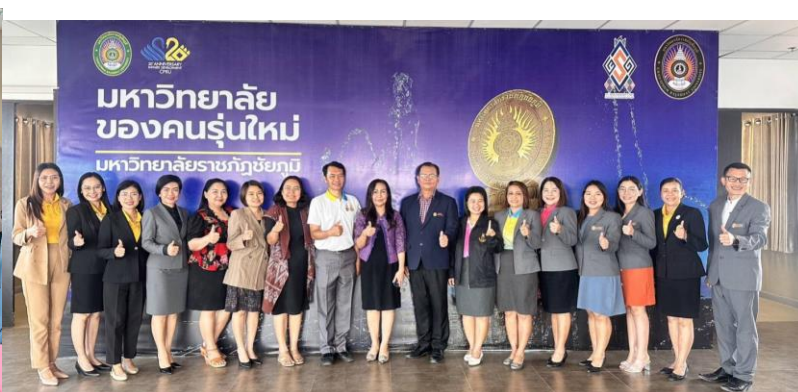
ร่วมเป็นคณะกรรมการอบรมพัฒนา นักศึกษาระดับปริญญาตรี ปริญญาโท

ปัจจุบันข้าพเจ้ากำลังศึกษา ระดับปริญญาเอก สาขาบริหารการศึกษา มหาวิทยาลัยราชภัฏชัยภูมิ