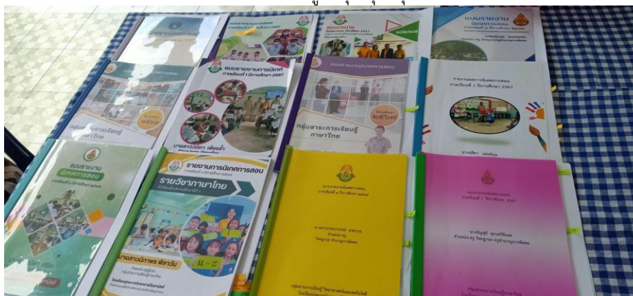
แบบรายงานการนิเทศการสอนครู