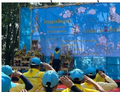
กิจกรรมโครงการจิตอาสาผู้นำโดย นายอำเภอเนินสง่า