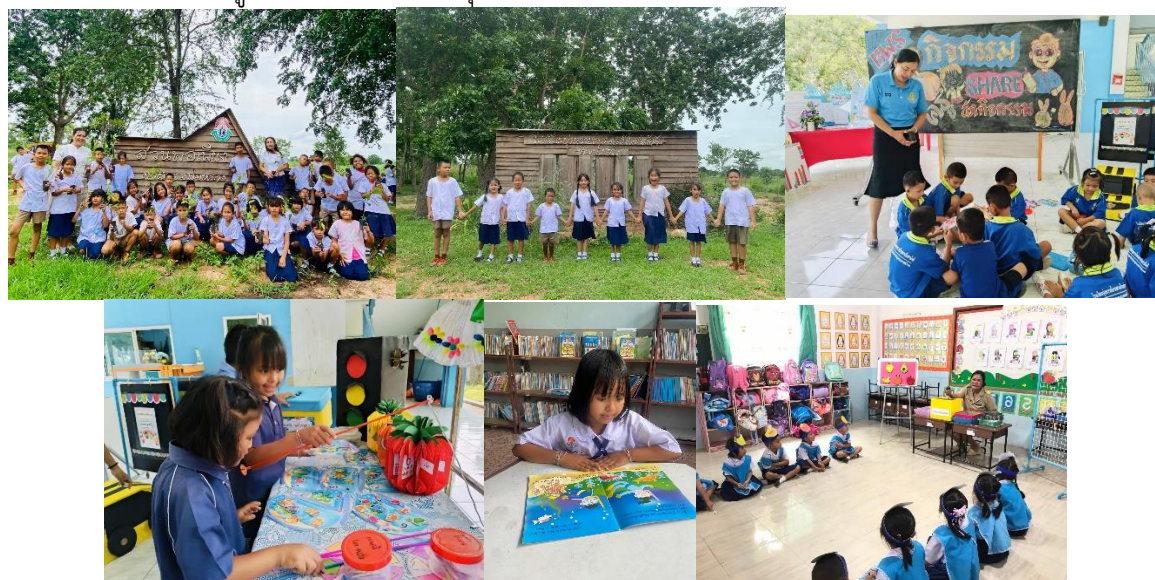
ส่งเสริมแหล่งเรียนรู้ทั้งในห้องเรียนและนอกห้องเรียน