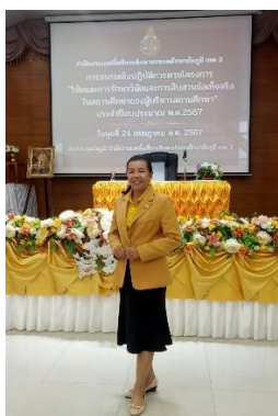
อบรมเชิงปฏิบัติการโครงการรักษาวินัย และสืบสวนข้อเท็จจริงฯ จัดโดย สพป.ชย.๓