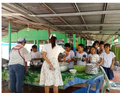
อาหารสะอาด ปลอดภัย