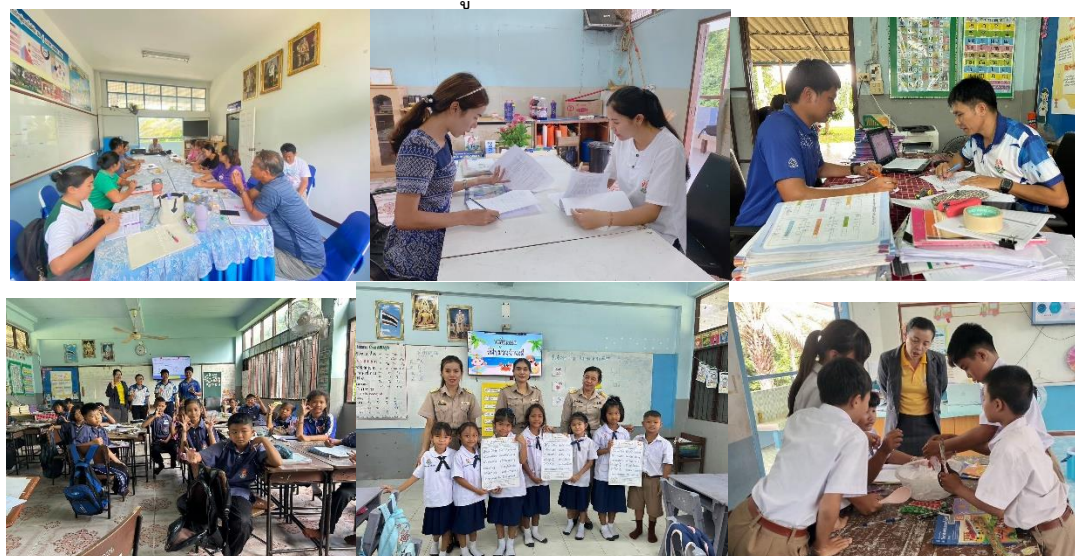
ประชุมครู PLC คณะกรรมการออกนิเทศการจัดการเรียนการสอน