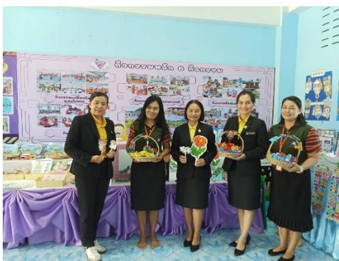
ศึกษาดูงาน ณ โรงเรียนอนุบาลลานสัก จ.อุทัยธานี