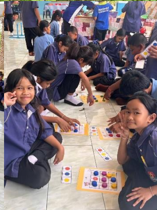
กิจกรรมการเรียนรู้เชิงรุก ทุกกลุ่มสาระ