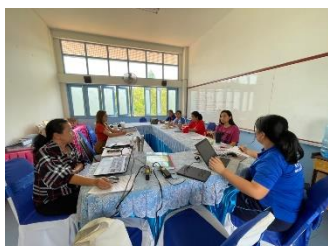
ประชุมครู