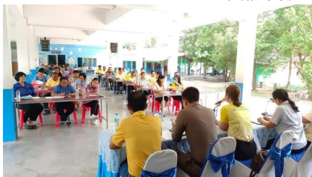
การประชุมหัวหน้าส่วนราชการอำเภอเนินสง่า