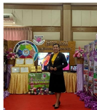
ศึกษาดูงาน โรงเรียนคุณภาพ สพป.ชย.๓