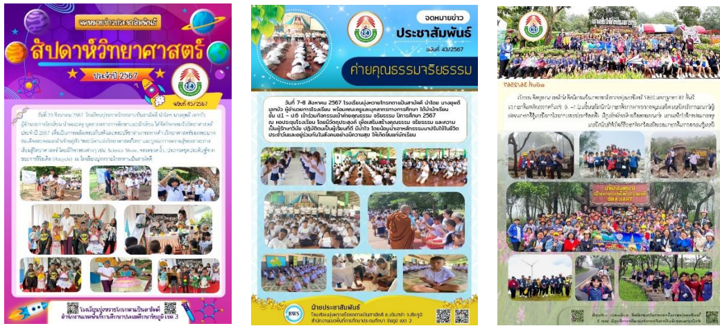
ภาพ การพัฒนาส่งเสริมผู้เรียนตามศักยภาพ สร้างเสริมประสบการณ์ และนำหลักคุณธรรมมาพัฒนาตนเอง