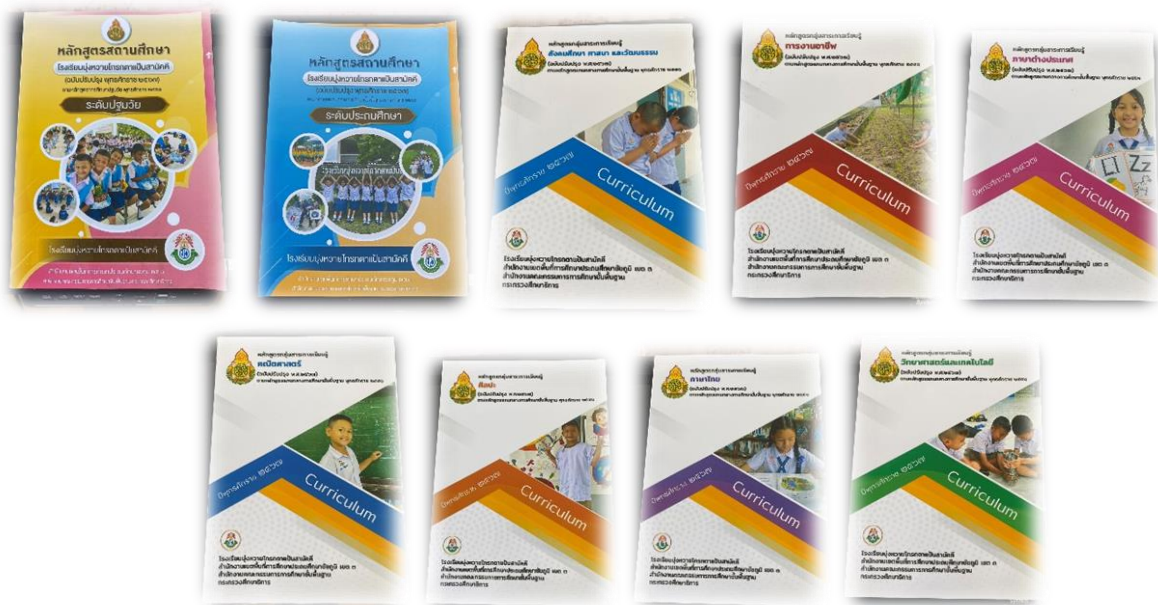
หลักสูตรสถานศึกษา ร.ร.บึงหวายโกรกตาเป็นสามัคคี ปีการศึกษา ๒๕๖๗