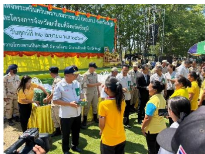
จังหวัดเคลื่อนที่นำโดยผู้ว่าราชการจังหวัดชัยภูมิ