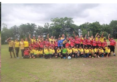
กิจกรรมแข่งขันกีฬาด้านยาเสพติด