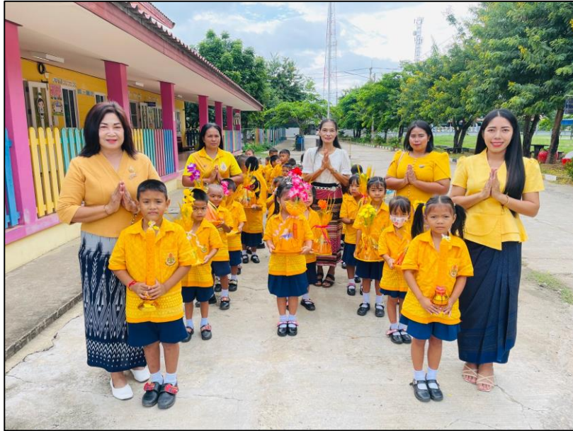
ภาพกิจกรรม

๖. กิจกรรมถวายเทียนพรรษา เมื่อวันที่ ๑๙ กรกฎาคม ๒๕๖๗ นักเรียน ครู ผู้บริหารสถานศึกษาและบุคลากรทางการศึกษาโรงเรียนชุมชนชนวนวิทยาร่วมกิจกรรมถวายเทียนพรรษาและผ้าอาบน้ำฝน ณ วัดบึงชวน และวัดป่าสำราญจิต เนื่องในวัน อาสาฬหบูชาและวันเข้าพรรษา