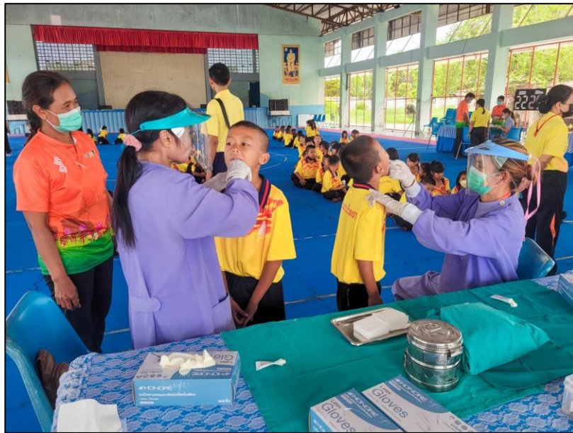
ภาพกิจกรรม

๑. กิจกรรมการตรวจสุขภาพนักเรียน เมื่อวันที่ ๓ - ๔ กรกฎาคม ๒๕๖๗ นักเรียนชั้นประถมศึกษาปีที่ ๑ - ๖ โรงเรียนชุมชนชนวนวิทยา ได้รับการตรวจสุขภาพประจำปี จากโรงพยาบาลส่งเสริมสุขภาพตำบลบ้านชนวน