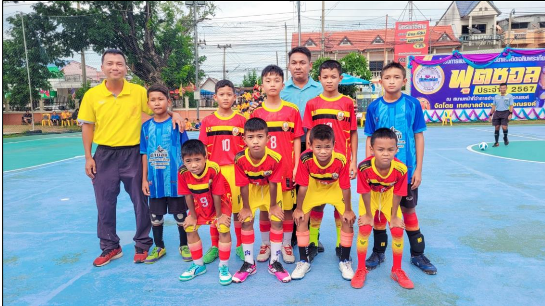
ภาพกิจกรรม

๗. กิจกรรมการแข่งขันกีฬาฟุตบอล เมื่อวันที่ ๑๕ กรกฎาคม ๒๕๖๗ โรงเรียนชุมชนชนวนวิทยา นำนักเรียนเข้าร่วมการแข่งขันกีฬาฟุตบอล รุ่นอายุไม่เกิน ๑๐ ปี และรุ่นอายุไม่เกิน ๑๒ ปี กีฬาฟุตบอลด้านยาเสพติด จัดโดยเทศบาลตำบลบำเหน็จณรงค์ ได้รับรางวัลรองชนะเลิศอันดับที่ ๑ ในรุ่นอายุไม่เกิน ๑๒ ปี