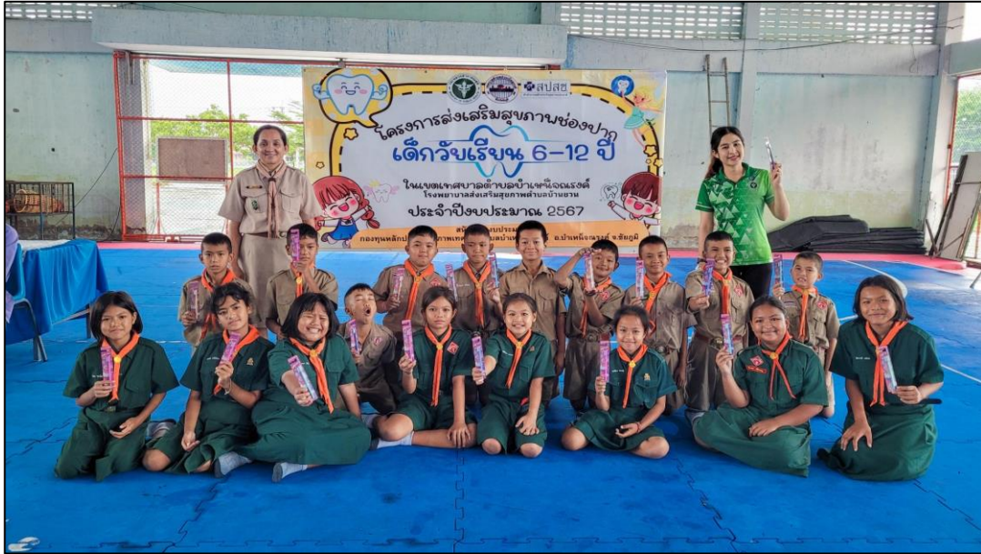
ภาพกิจกรรม

๔. กิจกรรมโครงการส่งเสริมสุขภาพช่องปาก เมื่อวันที่ ๔ กรกฎาคม ๒๕๖๗ นักเรียนโรงเรียนชุมชน ชนวนวิทยา ระดับชั้นประถมศึกษาปีที่ ๕ - ๖ เข้าร่วมการตรวจสุขภาพช่องปากตามโครงการส่งเสริมสุขภาพช่องปาก จากโรงพยาบาลส่งเสริมสุขภาพตำบลบ้านชนวน ในเขตเทศบาลตำบลบำเหน็จณรงค์