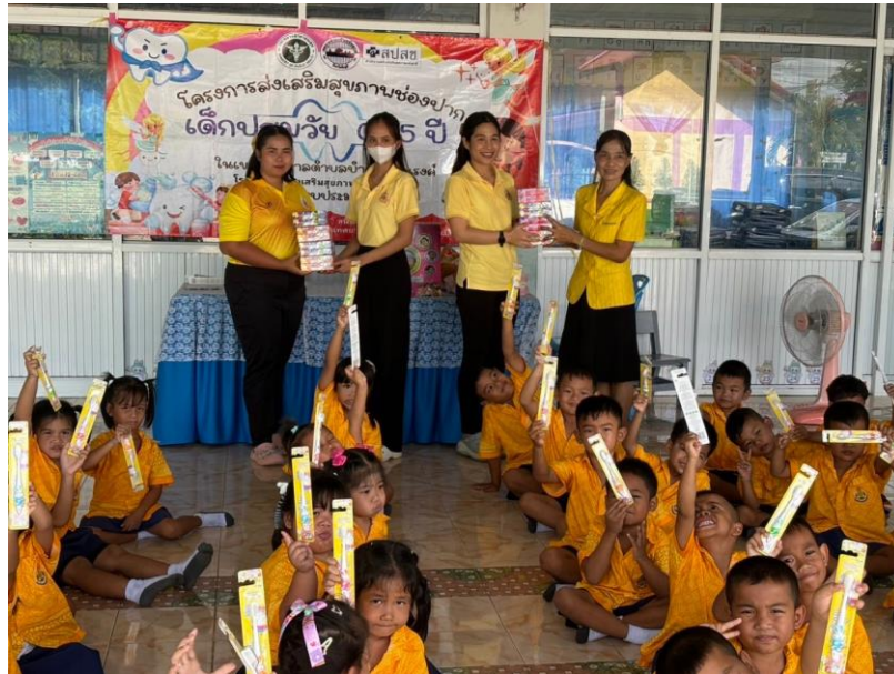
ภาพกิจกรรม

๑๐. กิจกรรมตรวจสุขภาพช่องปาก เมื่อวันที่ ๒๖ กรกฎาคม ๒๕๖๗ นักเรียนระดับชั้นอนุบาลปีที่ 1 - ๓ เข้ารับการตรวจสุขภาพช่องปาก ตามโครงการส่งเสริมสุขภาพช่องปาก เด็กปฐมวัย ๐ - ๕ ปี จากโรงพยาบาลส่งเสริมสุขภาพตำบลบ้านชวน ในเขตเทศบาลตำบลบำเหน็จณรงค์