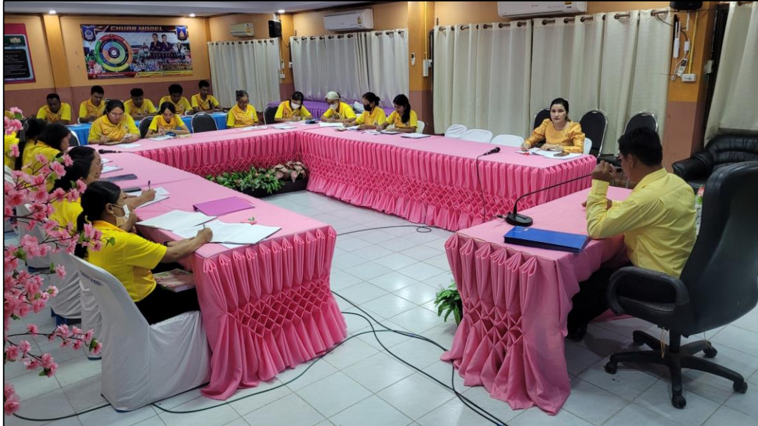
ภาพกิจกรรม

๕. กิจกรรมการประชุมครู เมื่อวันที่ ๘ กรกฎาคม ๒๕๖๗ ข้าราชการครูและบุคลากรทางการศึกษา โรงเรียนชุมชนชนวนวิทยา ร่วมการประชุมประจำเดือน กรกฎาคม