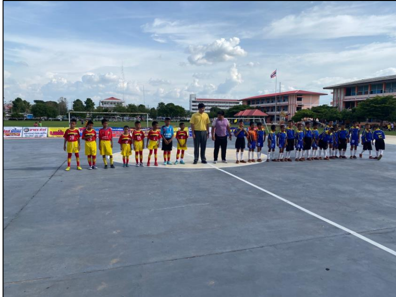
ภาพกิจกรรม

๒. กิจกรรมการแข่งขันกีฬาฟุตบอลเล็ก เมื่อวันที่ ๓ กรกฎาคม ๒๕๖๗ โรงเรียนชุมชนชนวนวิทยาจัดการแข่งขันกีฬาฟุตบอลเล็ก ในรุ่นอายุไม่เกิน ๑๐ ปี