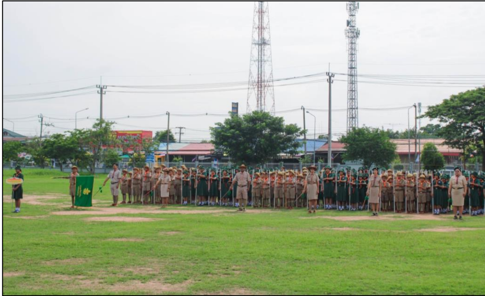
ภาพกิจกรรม

๓. กิจกรรมการทบทวนคำปฏิญาณและสวนสนาม เมื่อวันที่ ๔ กรกฎาคม ๒๕๖๗ โรงเรียนชุมชนชนวน วิทยาจัดกิจกรรมทบทวนคำปฏิญาณและสวนสนาม กองลูกเสือสำรอง และกองลูกเสือ เนตรนารีสามัญ โรงเรียน ชุมชนชนวนวิทยา