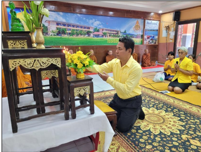
ภาพกิจกรรม

๙. กิจกรรมวันพ่อแห่งชาติ เมื่อวันที่ ๒๖ กรกฎาคม ๒๕๖๗ โรงเรียนชุมชนชนวนวิทยาจัดกิจกรรมทำบุญ ตักบาตรข้าวสารอาหารแห้ง กิจกรรมลงนามถวายพระพร กิจกรรมถวายสัตย์ปฏิญาณเพื่อเป็นข้าราชการที่ดีและ กิจกรรมการบำเพ็ญประโยชน์ เนื่องในโอกาสพระราชพิธีมหามงคลเฉลิมพระชนมพรรษา ๖ รอบ พระบาทสมเด็จพระเจ้าอยู่หัว รัชกาลที่ ๑๐