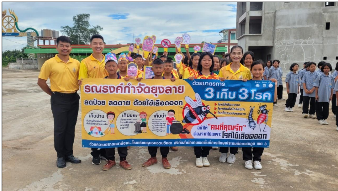
ภาพกิจกรรม

๘. กิจกรรมการณรงค์กำจัดยุงลาย เมื่อวันที่ ๒๕ กรกฎาคม ๒๕๖๗ โรงเรียนชุมชนชนวนวิทยานำนักเรียนชั้นประถมศึกษาปีที่ ๕ - ๖ เข้าร่วมกิจกรรมการณรงค์กำจัดยุงลาย ร่วมกับเทศบาลตำบลบ้านเหนือจนรังค์