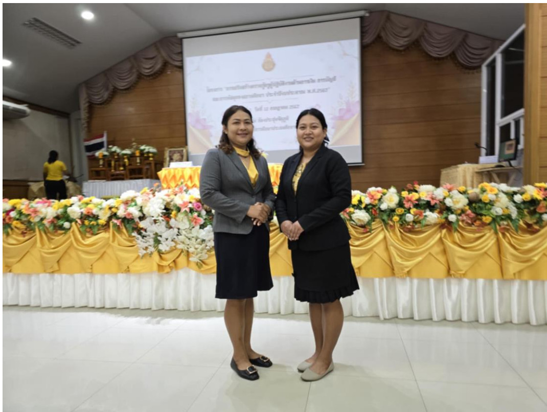
2. ผู้ดำเนินการคัดกรองคนพิการทางการศึกษา