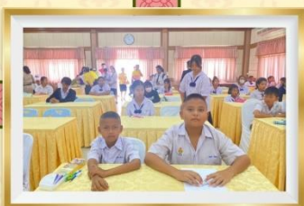
กิจกรรม "รักษ์ภาษาไทย" เนื่องในสัปดาห์วันภาษาไทย ปี ๒๕๖๗ ระดับเขตพื้นที่การศึกษาประถมศึกษาชัยภูมิ เขต ๓