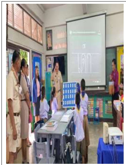
รับการนิเทศเปิดเรียนและการเลือกตั้งประธานนักเรียน