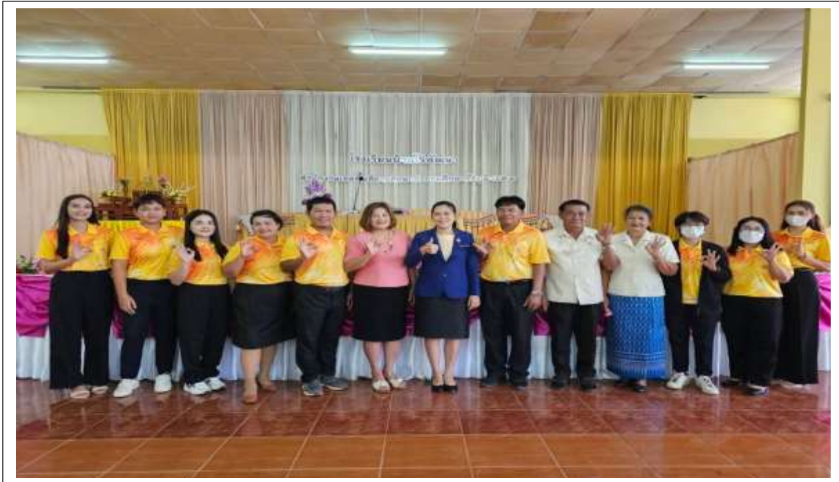
ประชุมเปิดกล่องซอส์