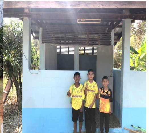
ซ่อมแซมห้องน้ำนักเรียน