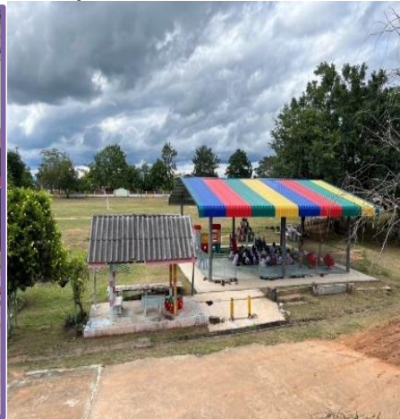
ปรับปรุงเทพื้นรอบๆสนามเด็กเล่น