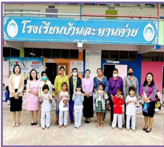
ชุมชนระดมทุนมอบเงินทุนการศึกษา

ได้ริเริ่มพัฒนา การสร้างความร่วมมือกับผู้เรียน ครู คณะกรรมการสถานศึกษา ผู้ปกครอง ชุมชน ผู้ที่มีส่วนเกี่ยวข้องและเครือข่ายเพื่อพัฒนาการจัดการเรียนรู้ และเสริมสร้างคุณธรรม จริยธรรม และพัฒนาคุณลักษณะอันพึงประสงค์ช่วยเหลือและพัฒนาโดยเน้นการมีส่วนร่วมจากทุกฝ่าย โดยส่งผลให้ผู้เรียนร้อยละ ๙๐ ได้พัฒนาและนำความรู้ไปประกอบอาชีพเพื่อสร้างรายได้เสริมให้ครอบครัวได้ มีอัตลักษณ์สูงกว่าเกณฑ์ที่สถานศึกษากำหนดเป้าหมายไว้เพิ่มขึ้นมาอีก ครูร้อยละ ๑๐๐ มีเครือข่ายชุมชนการเรียนรู้เพื่อพัฒนาคุณภาพการศึกษาตามเกณฑ์ที่ตั้งไว้ มีเครือข่าย ผู้เรียน ครู คณะกรรมการสถานศึกษา ผู้ปกครอง ชุมชน เพื่อพัฒนาการจัดการเรียนรู้ ห้างหุ้นส่วนจำกัดต่างๆ รวมถึงผู้นำชุมชน ชาวบ้าน ได้ช่วยเข้ามาส่งเสริม สนับสนุนให้สถานศึกษาพัฒนา ทั้งด้านวิชาการ ด้านอาคารสถานที่ และด้านผู้เรียน ระดมทุนจัดหาสื่อการเรียนการสอนเงินผ้าป่า ปรับปรุงห้องน้ำ จัดสร้างโดม ซื้อเครื่องเล่นสนาม เทพื้นรอบๆสนาม ซื้อโต๊ะเก้าอี้นั่งเรียนและโต๊ะเก้าอี้ให้โรงอาหาร มอบทุนการศึกษาให้กับนักเรียน มอบอุปกรณ์การเรียน และเป็นวิทยากร ท้องถิ่นส่งเสริมอาชีพและวิทยากรอื่นๆจากผู้ปกครอง ชุมชนและหน่วยงานภายนอก