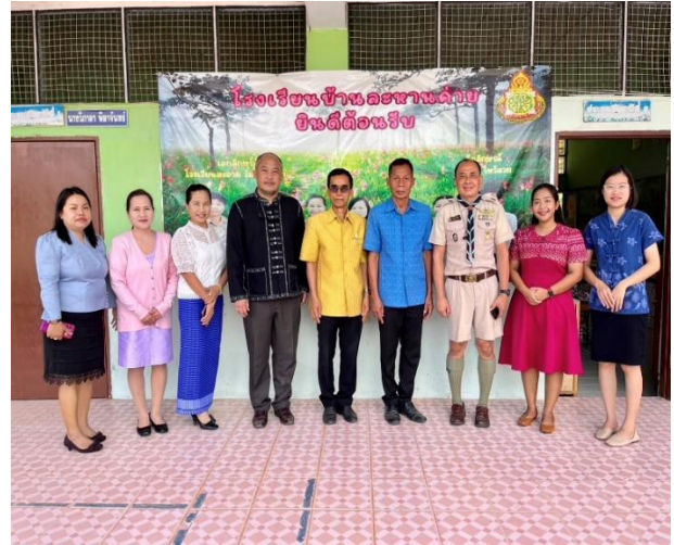
ศึกษานิเทศก์ ผู้บริหารเครือข่ายหนองบัวระเหว ดูแล ชี้แนะ