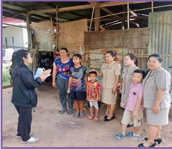
เยี่ยมบ้านนักเรียน ๑๐๐ เปอร์เซ็นต์

มาตรฐาน ครูนักเรียนได้ศึกษาและสอบผ่านนักรธรรมชั้นเอก โท ตรี ทุกคน นวัตกรรมทำให้นักเรียนมีคุณภาพชีวิตที่ดี ส่งผลให้ผู้เรียนมีผลสัมฤทธิ์ทางการเรียนสูงขึ้น ได้รับรางวัลเชิดชูเกียรติเสมาป.ป.ส.ระดับทองโครงการโรงเรียนสีขาว ปลอดภัย สะอาด และอบายมุข