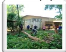
ชุมชนพัฒนาโรงเรียน