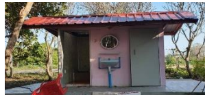
ติดประตู ปูกระเบื้อง ติดกระจก ติดตั้งอ่างล้างมือ ต่อน้ำ ทาสี