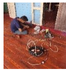
ปรับปรุงซ่อมแซมประตูหน้าต่าง