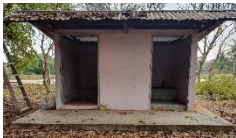
ปรับปรุงซ่อมแซมห้องน้ำ