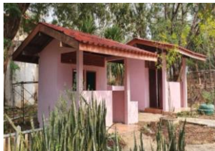
ซ่อมแซมปรับปรุงทาสีห้องน้ำใหม่