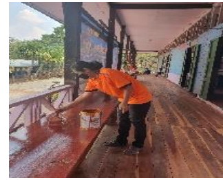
ทาสีหน้าอาคาร