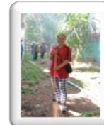
ร่วมพัฒนาโรงเรียน