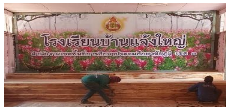
ทำเวทีในห้อง