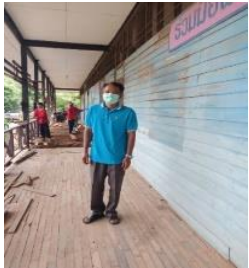
เปลี่ยนพื้นหน้าอาคาร