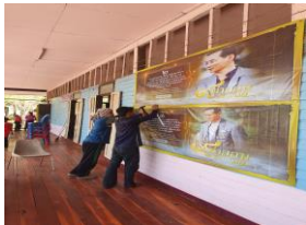
ติดป้าย ๙ คำสอนของพ่อ