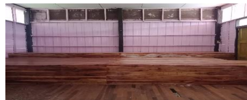
ทำเวทีภายในห้องเรียน