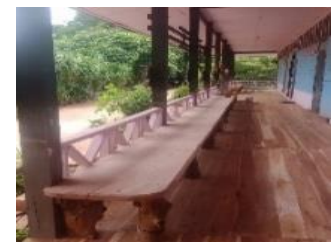
ทำพื้นไม้ประดู่ ทำระเบียง