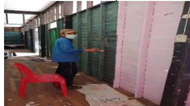
ทาสีฝาผนังห้อง