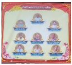
เครือข่ายผู้ร่วมพัฒนาโรงเรียน

๔.๒ ดำเนินการระดมทรัพยากรเพื่อการศึกษาให้บริการด้านวิชาการแก่ชุมชน และงานจิตอาสาเพื่อสร้างเครือข่ายในการพัฒนาคุณภาพการศึกษา โรงเรียนบ้านแจ้งใหญ่ได้รับการสนับสนุนด้านงบประมาณจากเครือข่ายผู้ร่วมพัฒนาโรงเรียน