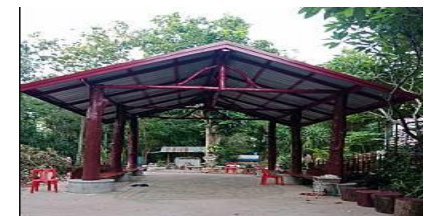
ทำศาลาพักร้อนหน้าอาคาร