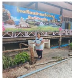
ทาสีรั้วสวนหย่อม