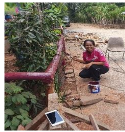
ทาสีรั้ว