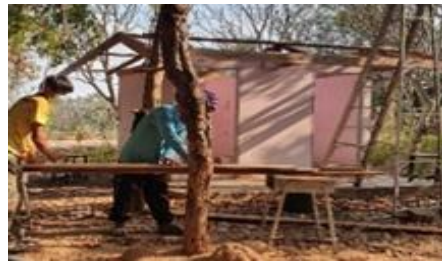
ทำห้องน้ำอนุบาล