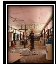
ทาสีฝ้าเพดาน