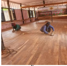
ขัดพื้นห้อง