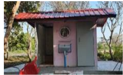
ทำห้องน้ำอนุบาล