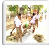
พัฒนาโรงเรียน