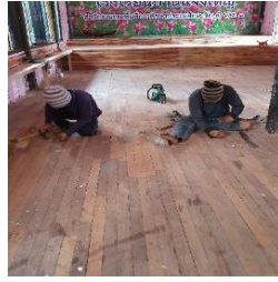
ซ่อมแซมพื้นห้องที่ชำรุด