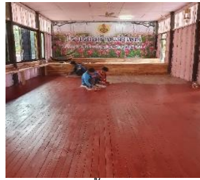
ทาสีพื้นห้องใหม่