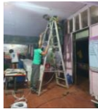
ปรับปรุงซ่อมแซมไฟฟ้า