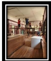
ซ่อมแซมฝ้าเพดาน