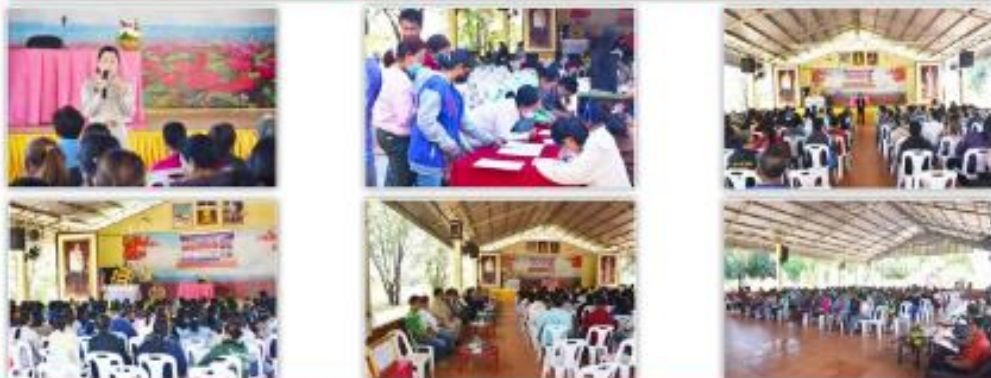
งานประชาสัมพันธ์ โรงเรียนบ้านโนนจาน(เนตรชนันธราษฎร์บำรุง)

วันจันทร์ ที่ 20 พฤศจิกายน 2566 โรงเรียนบ้านโนนจาน(เนตรชนันธราษฎร์บำรุง) จัดประชุมผู้ปกครองนักเรียนภาคเรียนที่ 2 ปีการศึกษา 2566 เพื่อเป็นการรายงานผลการบริหารจัดการศึกษาที่ผ่านมา หาแนวทางในการจัดการศึกษา การจัดทำผ้าป่าเพื่อการศึกษาสร้างความสัมพันธ์ที่ดีระหว่างโรงเรียน ครูและผู้ปกครองในการส่งเสริม พัฒนาโรงเรียนและบุคลากรให้มีคุณภาพพร้อมกันต่อไป โดยได้รับความร่วมมือจากคณะกรรมการสถานศึกษาและผู้ปกครองนักเรียนเข้าร่วมประชุมอย่างพร้อมเพรียงกัน ขอขอบพระคุณเป็นอย่างสูง