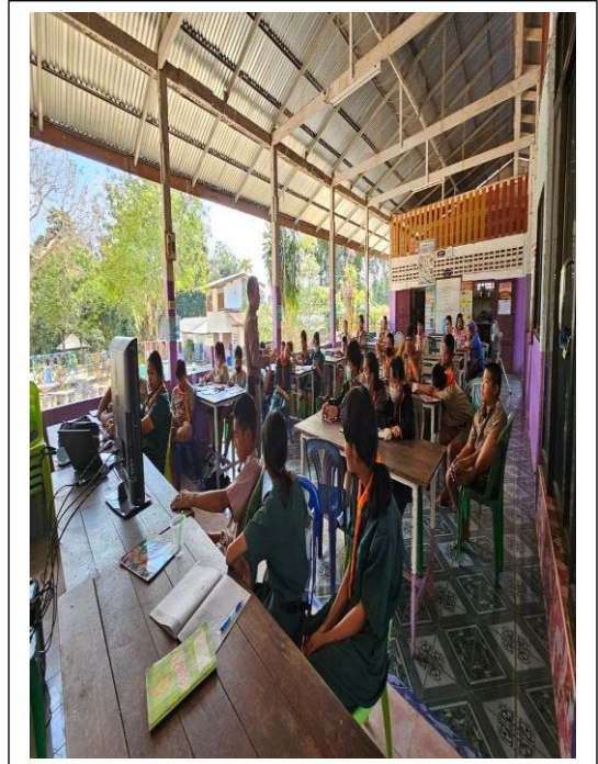
การประชุมอบรมกิจกรรมครูแดร์ หนึ่ ซ่อน สู้