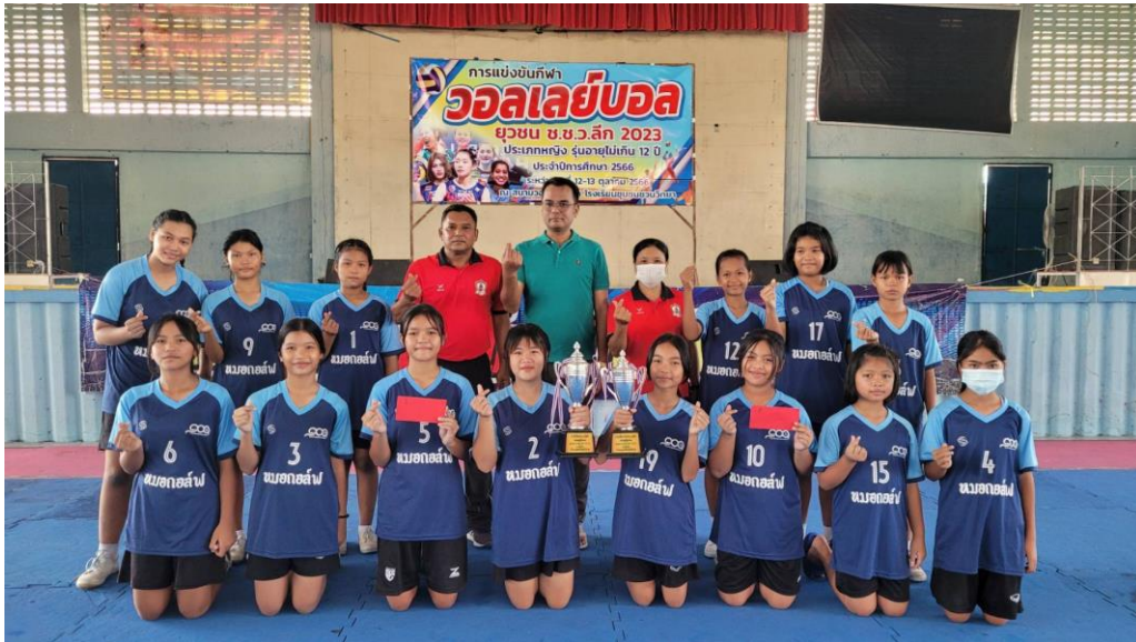
ภาพกิจกรรม

๒. กิจกรรมการแข่งขันกีฬาวอลเลย์บอล เมื่อวันที่ ๑๒ - ๑๓ ตุลาคม ๒๕๖๖ โรงเรียนชุมชน ชนวนวิทยาจัดการแข่งขันกีฬาวอลเลย์บอล ยูวชน ช.ช.ว. ลีก ๒๐๒๓