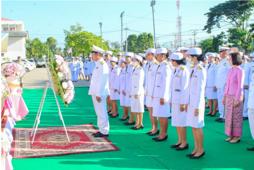
ภาพกิจกรรม

๒. กิจกรรมน้อมรำลึกเนื่องในวันคล้ายวันสวรรคตพระบาทสมเด็จพระจุลจอมเกล้าเจ้าอยู่หัว เมื่อวันที่ ๒๓ ตุลาคม ๒๕๖๖ ข้าราชการครูและบุคลากรทางการศึกษาโรงเรียนชุมชนชนวนวิทยา ร่วมกิจกรรมน้อมรำลึกเนื่องในวันคล้ายวันสวรรคตพระบาทสมเด็จพระจุลจอมเกล้าเจ้าอยู่หัว ณ ที่ว่าการอำเภอป่าหน่วจังหวัดชัยภูมิ